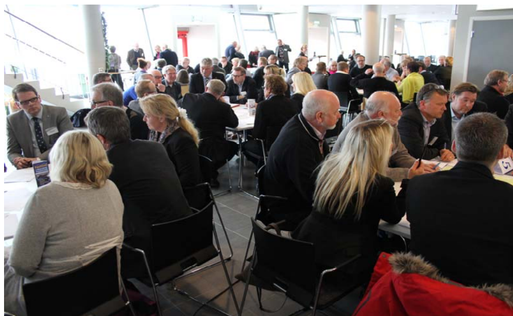
Näringslivet, föreningslivet, politiken och tjänstemän diskuterar vid ett stormöte i Arena Vänersborg den 19 mars 2013 hur kommunen ska utvecklas och tillväxt skapas så att vi når den önskade målbilden Vänersborg 2024.

Tröghet i byråkratiska kvarnar har arbetats bort till förmån för enkelhet och korta beslutsvägar. Vår kommun kännetecknas av att vi känner varandra väl, våra olika behov och förutsättningar. Här hittar vi lösningarna tillsammans.”